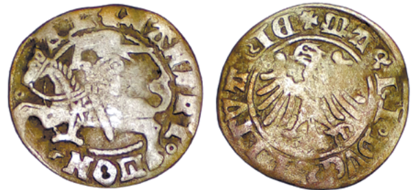
Полугрош Александра Ягеллончика (1501–1502 гг.)

Наиболее интересные монеты этого достаточно простого по составу клада выявлены среди эмиссий Великого Княжества Литовского. Они представлены тремя эмитентами. Первый – это Александр Ягеллончик (1492–1506). Его монет в кладах 30 ед. Это полугроши, 18 из которых относятся к периоду 1495–1500 гг. (готический стиль), 11 ед. – к периоду 1502–1506 гг. (ренессансный стиль) и одна монета смешанного типа, датируемая 1501–1502 гг., с ренессансным аверсом и готическим реверсом ( рисунок 1 ).