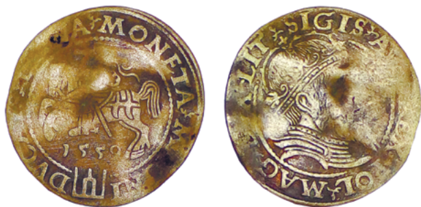
Грош Сигизмунда Августа (1559 г.)

Монеты Сигизмунда II Августа (1544–1568) также в основном представлены полугрошами с 1545 г. по 1565 г. (кроме 1551 г. и 1553 г.), одним с нечитаемой датой – эмиссии Виленского монетного двора, а также полугрошем 1566 г., отчеканенным в Тыкоцине. Всего насчитывается 102 полугроша. В кладе есть также четыре одногрошовика: два 1546 г. и один 1559 г. (рисунок 3), отчеканенные в Вильно по литовской стопе, и один 1568 г., отчеканенный в Вильно по польской стопе.