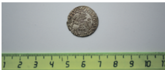
Полугроши 1562 г. Сигизмунда II Августа. Великое Княжество Литовское. Монетный двор Вильно