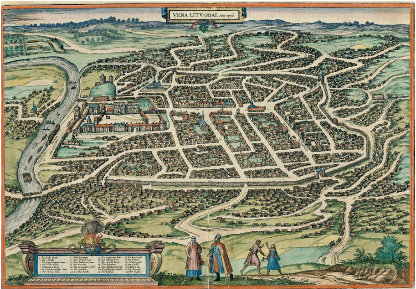
Карта Вільні 1576 г.

мент быў патрэбны Жыгімонту II Аўгусту для таго, каб свабодна вывозіць срэбра з Польшчы ў Літву, бо да гэтага часу дзейнічала сеймавая пастанова, якая пад пагрозай суролага пакарання забараняла вываз срэбра за межы краіны [4, с. 121].